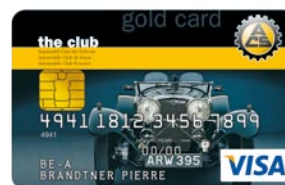
ACS VISA Card Gold

1) Carte principale Gold a partire da un reddito annuo lordo di 75 000 CHF. 2) Soltanto con la carta principale Gold