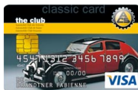
ACS VISA Card Classic